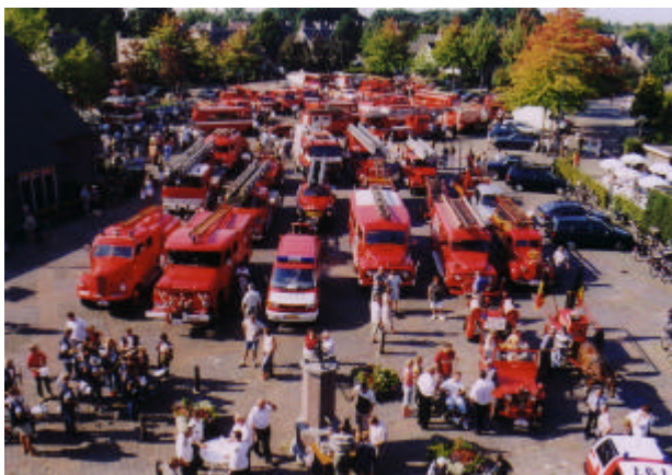
Na afloop van het defilé in Valkenswaard in september 2003 werd een overzichtsfoto van een aantal deelnemende voertuigen gemaakt.

Bij de uitgaven zijn vooral de posten werkmaterialen en onderhoud voertuigen ontzien, zoals eerder opgemerkt met het oog op de onzekere huisvestingssituatie. Andere opvallende afwijkingen van de begroting zijn de verdubbeling van het bedrag voor de verzekeringen, dat het gevolg is van het feit dat voor zowel 2003 als 2004 de premies in het verslagjaar zijn betaald en het bedrag voor consumpties van de vrijwilligers. Dat is n.l. in één keer besteed aan een etentje met alle vaste en ad-hoc vrijwilligers, die zich in de afgelopen jaren hebben ingespannen voor de BEBA. De overschrijding van de post die hiervan het gevolg was, werd door het voltallige dagelijks bestuur goedgekeurd.